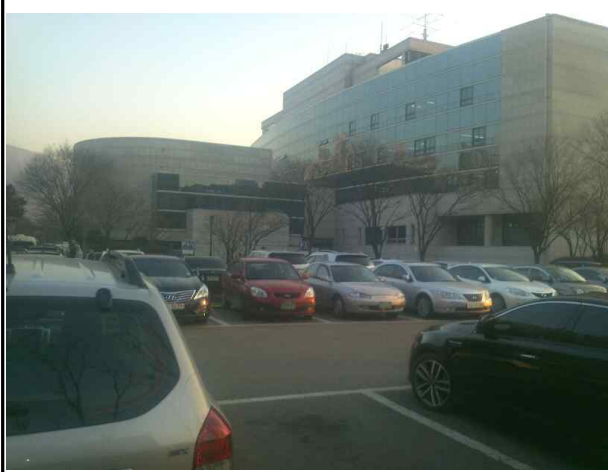
시청사 별관 증축 예정부지