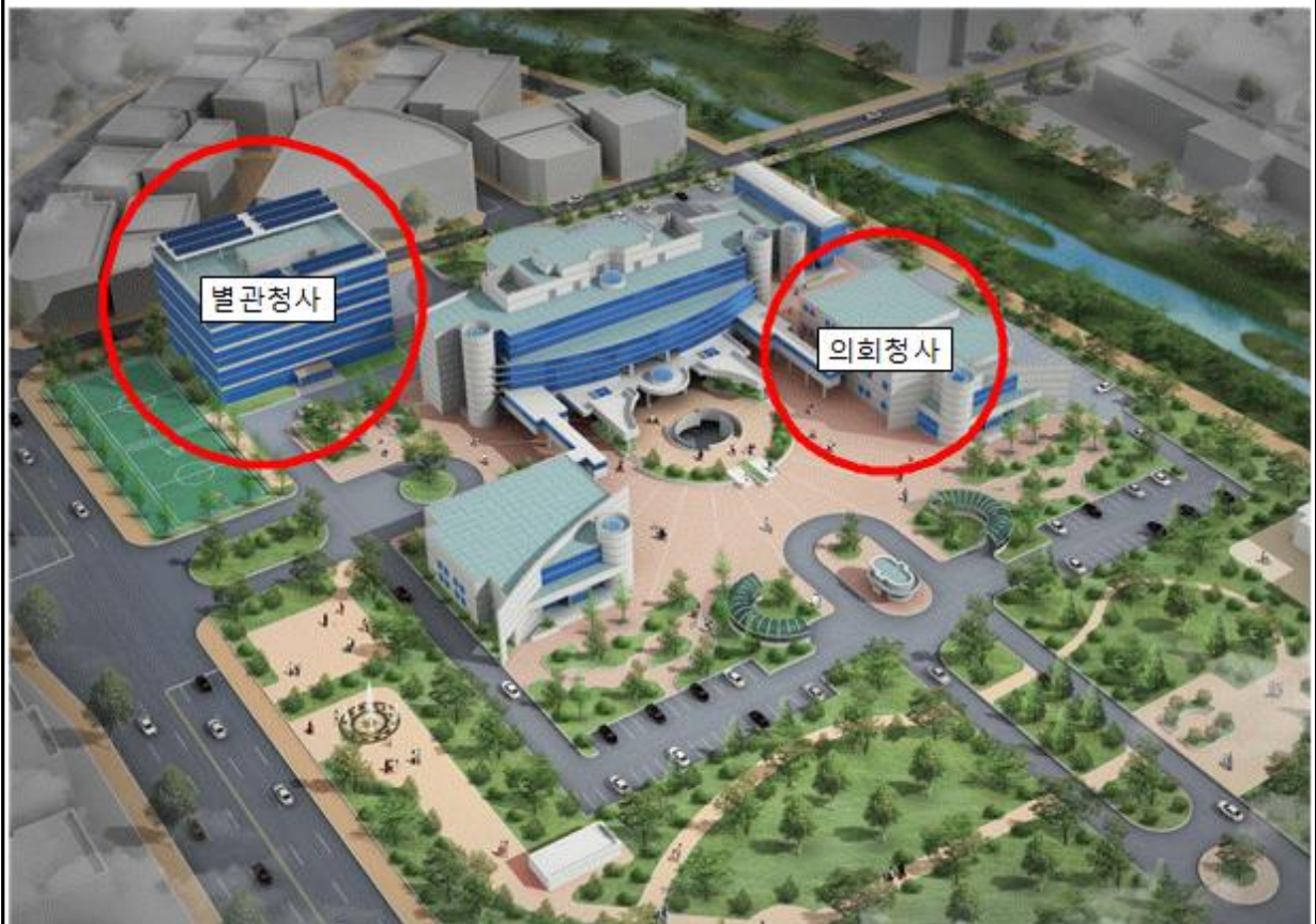
시청사 및 의회청사 증축 조감도(안)